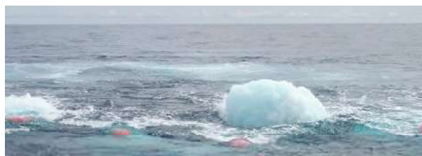
Figura 3: “profundidade mínima da água 5,5 M” (relatório final do barco da linha sísmica).