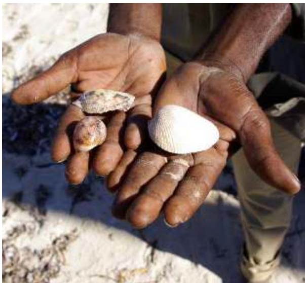
(Espécie de moluscos encontrados mortos na praia de Maganja no segundo dia do programa sísmico de águas rasas).

Morte de Moluscos: Finalmente, houve relatos de mortes de moluscos, também nos bancos de ervas marinhas perto de Maganja. Três espécies, em particular, foram mencionadas por pescadores como as que apareceram em abundância nas praias de Maganja, como se pode ver na Figura 1. Internacionalmente, existem poucos estudos sobre os impactos de fontes sonoras sísmicas nos moluscos, mas dada a proximidade das fontes sonoras ao fundo do mar durante o programa sísmico de águas rasas (5m de profundidade), é possível que a sua grande abundância nos bancos de ervas marinhas tenha, da mesma maneira, levado à sua maior taxa de mortalidade nas praias de Maganja.