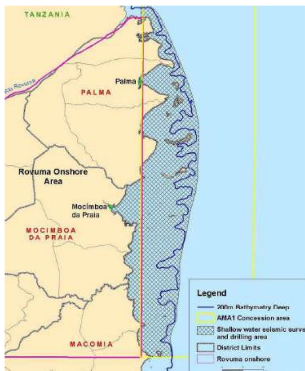
Figura 1: Área com mancha representa a zona com o programa sísmico de águas rasas (referência: Impacto ltd. Final EIA-Non-technical summary for Shallow Water Exploration Seismic Survey and Exploration Drilling, Rovuma Area 1)